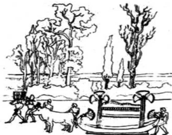
El Fúnebre Cortejo

Este fue trasladado en un lujoso carro fúnebre en forma de nave y sin ruedas, tirado por una yunta de bueyes de pintadas astas de forma de lira y con simbólicos arreos. Así lo fueron arrastrando lentamente sobre el polvo del camino, hacia la orilla del río.