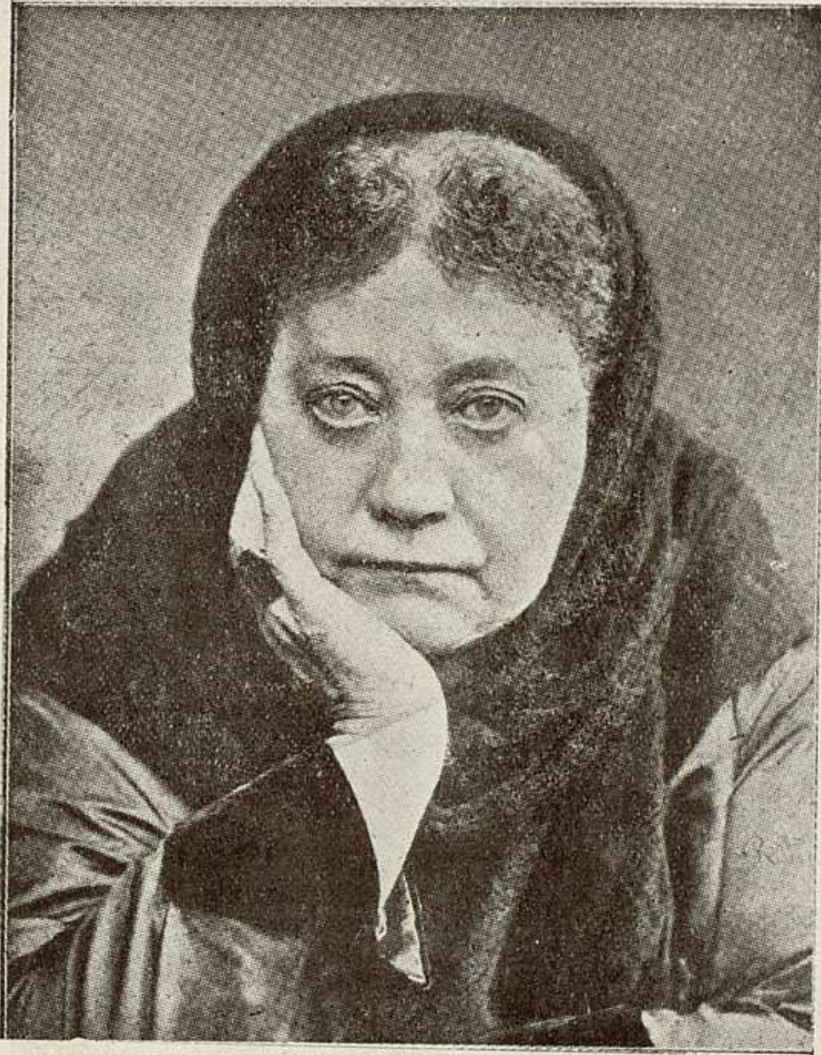
Helena Petrowna Hahn de Blavatsky.